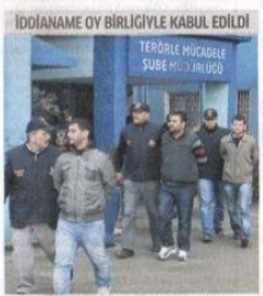
KCK soruşturmasında birçok ifade operasyon düzenlendi.

4 NISAN 2012 CARSAMBA YENİ TÜRKİYE'NİN GAZETESİ FİYAT: 50 KURUS KKTG: 1 TL